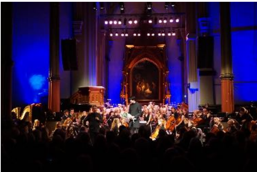
Under: Norges Ungdomssymfoniorkester, Kulturkirken Jakob 22. oktober