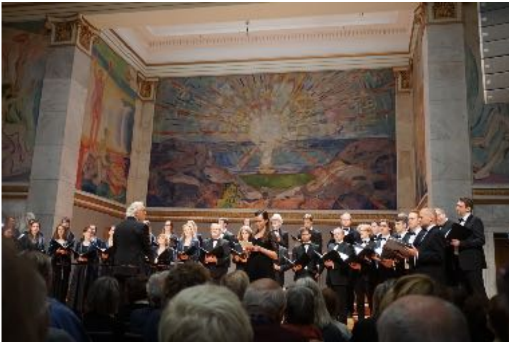
Over: Grex Vocalis, Aulaen, 22. oktober.

De trange økonomiske forutsetninger skapte kanskje flere samarbeid enn det ellers ville blitt. Disse samarbeidene vil være positivt for arena:klassisk fremover, og skaper optimisme for fremtiden. Oslo-Filharmonien vil f.eks. gjerne at vi neste gang er med på å programmere konserten deres under arena:klassisk. Det kom også mange henvendelser fra ensembler som ønsket å være med etter at det praktisk var mulig å få det til – noe som viser at interessen, behovet og ønsket for en slik faglig klassisk festival er stor.