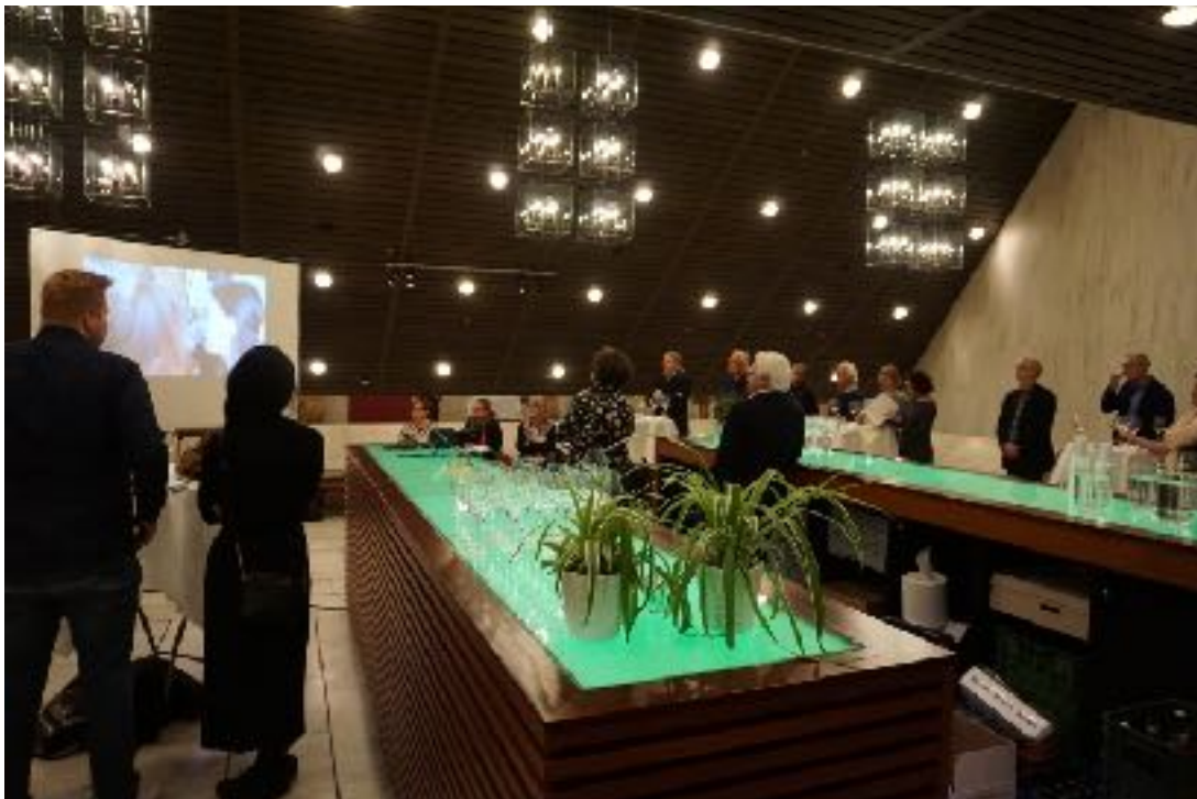
Åpningen, Oslo Konserthus

Samarbeid må være en viktig faktor ved vurdering av fremtidige arena:klassisk. Norsk Teater og Orkester Forening (NTO) er svært interessert i et samarbeid, Lindemann-prisen ble delt ut samme helg som arena:klassisk og Statoil var også interessert i mulig samarbeid. Det er viktig å kartlegge slike muligheter i god tid på forhånd, for å kunne dra størst mulig nytte av gjensidige fordeler ved et samarbeid.