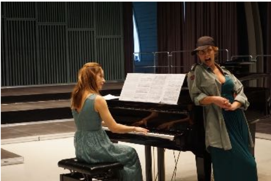
Mardraum, Ridehuset 20. oktober

En dedikert kommunikasjonsmedarbeider er avgjørende for å få til en god mediadekning. Det kreves nesten daglig oppfølging til hver medieaktør og i noen tilfeller bør det inngås samarbeid på forhånd - spesielt til de dedikerte aktørene som kan være interessert i klassisk musikk som ballade.no , klassiskmuskk.no , NRK alltid klassisk, hovedscenen, musikkultur, osv.