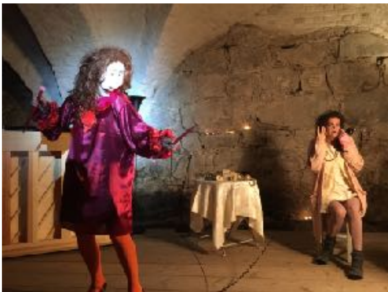
La Voix-ensemblet, Ladegården 20. oktober.