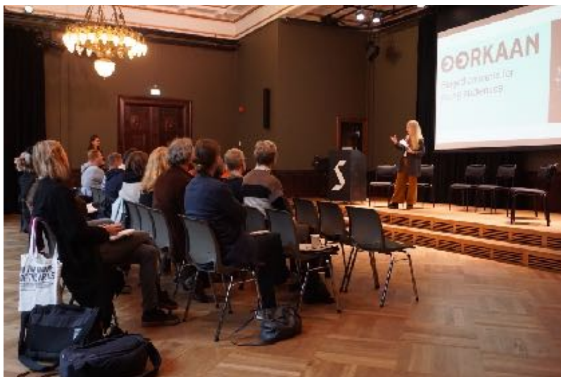
Debatt, Sentralen, 22. oktober.

https://www.youtube.com/watch?v=jCLtW5reJGc&t (promotionvideo på 2 minutter)